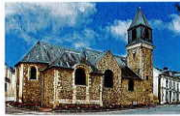
St Eustache 1543

Viroflay (Yvelines), commune résidentielle, 16.000 hab., entre Bois de Meudon et forêt de Fausses-Reposes. Trois gares : Viroflay Rive Gauche, Rive Droite et Chaville-Vélizy. Bus 171 sur l'ex RN 10. Tram T6